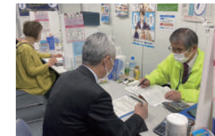
青色コーナーの様子

「青色コーナー」は、青色申告制度の普及と記帳能力の向上を目的とし、青梅税務署に設置され長年にわたり申告会がその活動の支援にあたっています。西多摩地域の一般納税者支援のための「青色コーナー」は、本年は確定申告期前の2月1日から青梅税務署に設置し4月1日まで、6名の専従スタッフと1名の本会スタッフが支援にあたり、691名の事業・不動産等の所得者の方々に説明・指導がおこなわれ、うち73名の方が青色申告の届出をされました。この公益活動は、申告会の活動をより多くの方にご理解いただく本会の重要事業です。