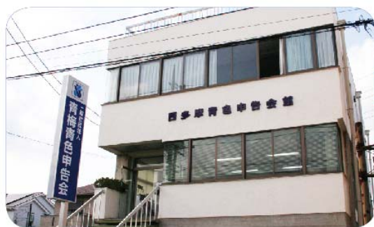
▶ JR青梅線「河辺駅」北口徒歩7分 霞台中学校北側