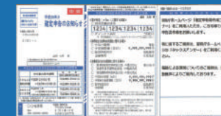
※「確定申告のお知らせ」はがきイメージです

用紙が必要な方は青色申告会にご用意しております。また、国税庁ホームページから様式をダウンロードできますのでご利用ください