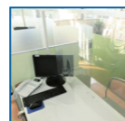
ビニールカーテンの設置